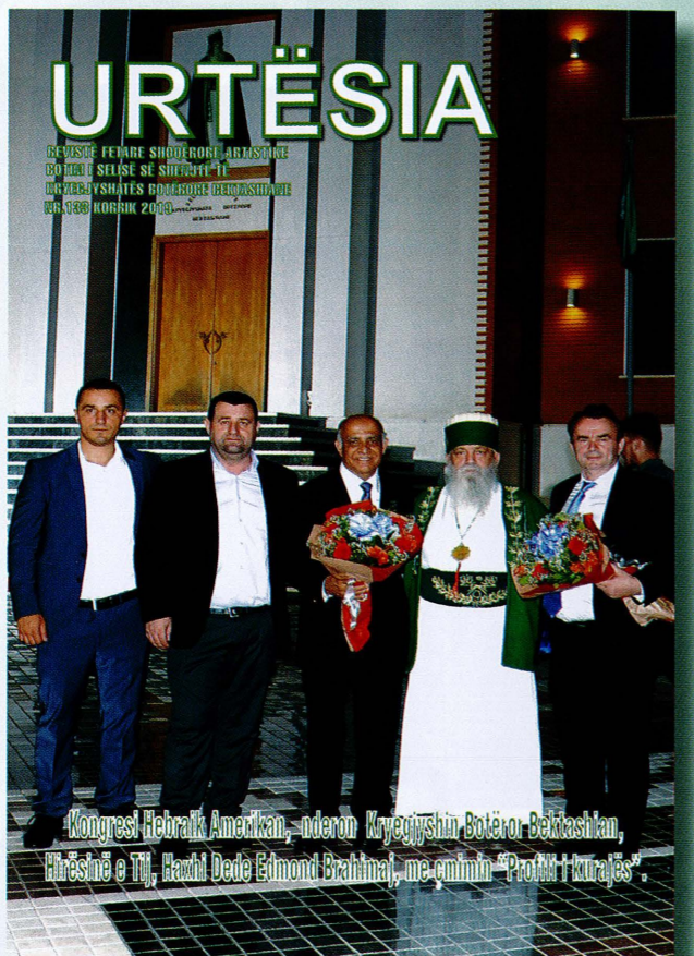
Kongresi Hebraik Amerikan, nderon Kryegjyshi Botëror Bektashian, Hirësinë e Tij, Haxhi Dede Edmond Brahimaj, me emnin "Profili i Kurajës".