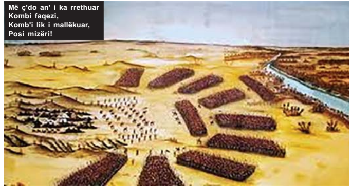
Më ç'do an' i ka rrethuar Kombi faqezi, Komb'i lik i mallëkuar, Posi mizëri!