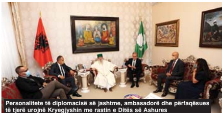
Personalitete të diplomacisë së jashtme, ambasadorë dhe përfaqësues të tjerë urojnë Kryegjyshin me rastin e Ditës së Ashures

Gjatë 10 ditëve, besimtarët bektashianë myslimanë, alevianë, kudo që ndodhen në botë, në më shumë se 31 vende ku janë dhe gjenden veprat e kultit të tyre, teqetë, tyrbet, mekame, si në Shqipëri, Kosovë, Maqedoni, Mal i Zi, Greqi, Bullgari, Rumani, Hungari, Egjipt, Turqi, Irak, Iran, Afganistan, Azerbajxhan, Turkmenistan, Tashkikistan, Pakistan, Rusi, Kinë, ShBA, Kanada, Australi, Francë, Belgjikë, Holandë, Zvicër etj., përkujtojnë në shenjë zie 72 luftëtarët, dëshmorët të rënë, heronj në Qerbelā, me në krye prijësin e tyre, shen-