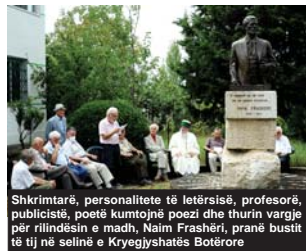
Shkrimtarë, personalitete të letërsisë, profesorë, publicistë, poetë kumtojnë poezi dhe thurin vargje për rilindësin e madh, Naim Frashëri, pranë bustit të tij në selinë e Kryegjyshitës Botërore