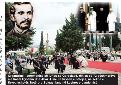
Organizimi i ceremonisë së luftës së Qerbelasë, rënies së 72 dëshmorëve me Imam Hysenin dhe Abaz Alinë në fushën e betejës, në selinë e Kryegjyshitës Botërore Bektashiane në kushtet e pandemisë