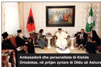
Ambasadore dhe personalitete të Kishës Ortodokse, në pritjen zyrtare të Ditës së Ashures