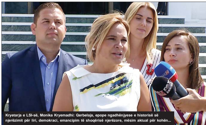
Kryetarja e LSI-së, Monika Kryemadhi: Qerbelaja, epope ngadhënjyese e historisë së njerëzimit për liri, demokraci, emancipim të shoqërisë njerëzore, mësim aktual për kohën...

mëkojë në të gjithë arabët islamit, si besim që duhet përfuar dhe se kjo do të arrihet vetëm kundër diktaturës së kohës, që ishte mishërim i obskurantizmit dhe idhujtarive, Jezitit të Mavisë. Kufa përjetonte më shumë ndryshime që kishin lind në vendet arabe dhe që banorët e saj ishin më të prirur për këto ndryshime. Imam Hyseni, duke qenë se në Kufë, ziente lufta midis besimtarëve dhe jobesimtarëve, pranoi kërkesat e shumta të banorëve të Kufës dhe sheitëve të Irakut, që të vinte e të vihej në krye të tyre për të përmbytur diktaturën. Dërgimi i letrave, pranimi i kërkesave të tyre, marrjes së besës nga banorët e Kufës dhe të Basras, nëpërmjet Myslym Akilit, përfaqësuesit të denjë të tij, në ditën e tetë të muajit Dhahixhe të vitit Hixhri la Mekën dhe iku në drejtim të Irakut.