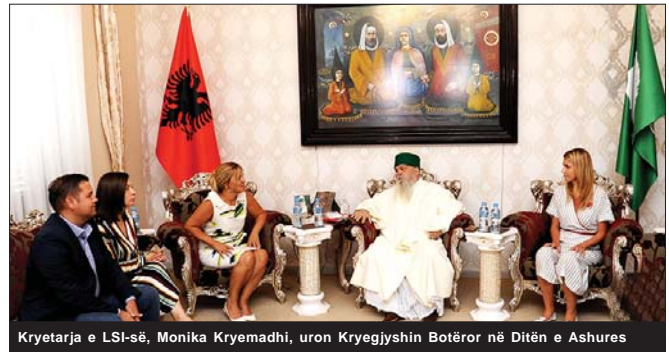
Kryetarja e LSI-së, Monika Kryemadhi, uron Kryegjyshin Botëror në Ditën e Ashures