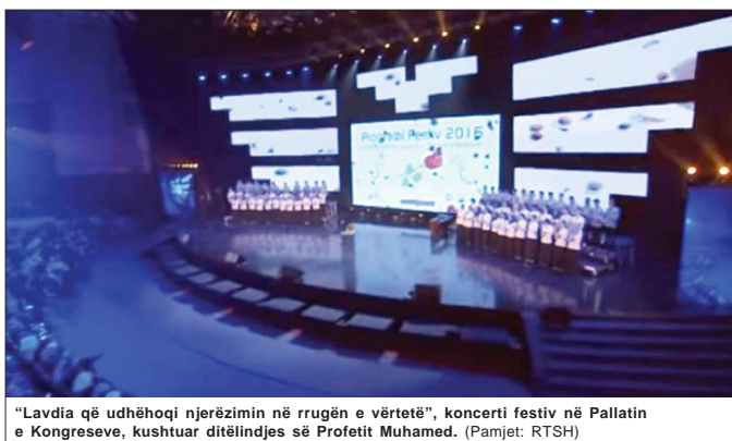
"Lavdia që udhëhoqi njerëzimin në rrugën e vërtetë", koncerti festiv në Pallatin e Kongreseve, kushtuar ditëlindjes së Profetit Muhamed.

20 prill 571, kishin kaluar vetëm 15 ditë nga ndodhia e elefantit. Ishte e hënë. Në këtë çast, kur drita kishte ndriçuar gjithë rruzullin, në botë erdhi jetimi i Aminës, i cili dëgjoi: "Allahu të mishëroftë!". Dhoma për një çast ishte