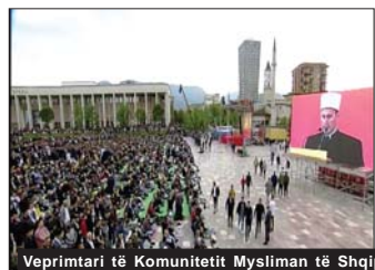
Veprimtari të Komunitetit Mysliman të Shqipërisë dhe Kryegjyshitës Botërore Bektashiane, kushtuar ngjarjeve të besimit Islam.

Profeti me përmbyshjen me shpatë të zotërve të rremë dhe me vendosjen e idesë me fjalë