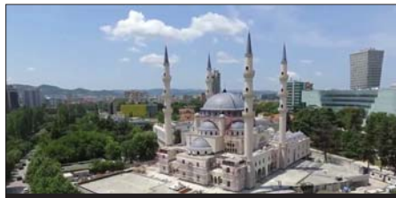
Xhamia e Namazgjasë, drejt përfundimit. Simbol i besimit të myslimanëve shqiptarë

Gëte: "Në histori kërkova shembullin e njeriut të shkëlqyer, atë e gjeta te Pejgamberi Muhamed".