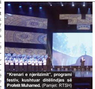
"Krenari e njerëzimit", programi festiv, kushtuar ditëlindjes së Profetit Muhamed.

kritere të gjenialitetit njerëzor, nuk qenë shfaqur ndonjëherë para ardhjes së Profetit. Udhtëqës të njohur krijues ushtri, ligje dhe shtete. Nuk formuan asgjë më tepër se potenciale materiale, të cilat shpesh u zhdukën para syrit të tyre. Profeti Muhamed themeloi jo vetëm armatat, legjislacionet, shtetin, por miliona njerëz, një e treta e botës së banuar të asaj kohe, madje edhe më shumë. Më tepër se kjo, ndryshoi altarët, zotat, fetë, idetë, besimet në shpirtira. Në