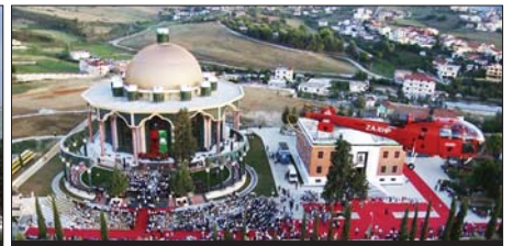
Kryegjyshata Botërore. Shtëpia e Zotit, e bisimtarëve myslimanë bektashianë, krenari e kombit